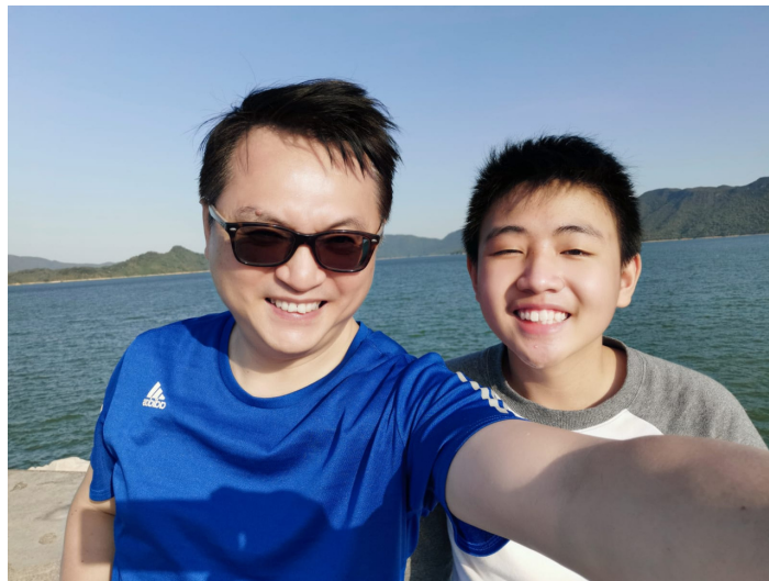
Super Teens 青少年戶外活動