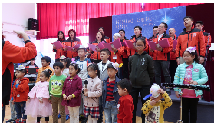
聖誕節弟兄姊妹與Super Kids 獻唱

求天父與我們眾人同在，繼續賜福葵福支堂，讓「葵福」成為「葵盛」這社區「福音」的燈臺，照亮他人生命。願榮一切耀全歸天父！