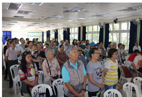
葵福首次戶外崇拜 (地點: 麥理浩夫人渡假村)