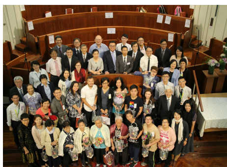
2016年葵福首屆受洗肢體