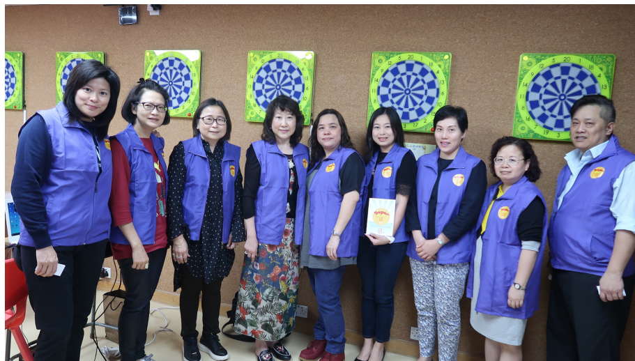
Super Kids 導師團隊

在未來的日子，期望我們所教導及關心的一班SUPERKIDS/SUPERTEENS，都能在神的話語中成長，能夠面對將來的挑戰、站立得穩，也期望我們一起努力的導師們都堅持初衷，愈事奉愈甘甜！